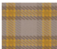
RASCH Collection FUNKY FLAIR 2015 Ref : 721 638 - 10,05 x 0,53 m - 30,66€ www.rasch.de