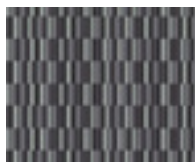
PS INTERNATIONAL Collection LOFTY Ref : 03972-10 - 10,05 m x 0,53 m - 24,90€ www.ps-international.de