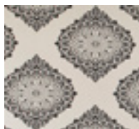
GRAHAM AND BROWN Collection Kelly Hoppen - Tatoo Ref : 30-416 - 10,05 x 0,52 m - 30€ www.grahambrown.com