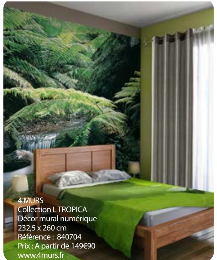
4 MURS Collection L TROPICA Décor mural numérique 232,5 x 260 cm Référence : 840704 Prix : A partir de 149€90 www.4murs.fr

Créée en 1999, l'Association pour la Promotion du Papier Peint (A3P) représente les principaux acteurs du papier peint en France : fabricants, éditeurs, distributeurs et partenaires.