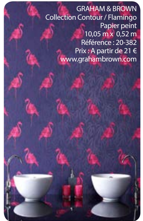
GRAHAM & BROWN Collection Contour / Flamingo Papier peint 10,05 m x 0,52 m Référence : 20-382 Prix : A partir de 21 € www.grahambrown.com