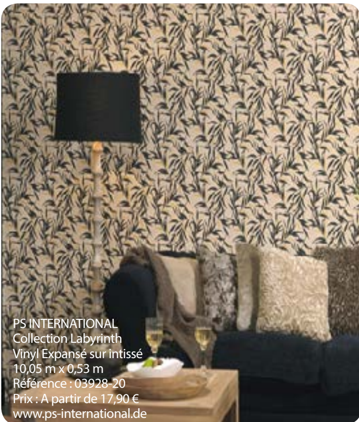
PS INTERNATIONAL Collection Labyrinth Vinyl Expandé sur intissé 10,05 m x 0,53 m Référence : 03928-20 Prix : A partir de 17,90 € www.ps-international.de