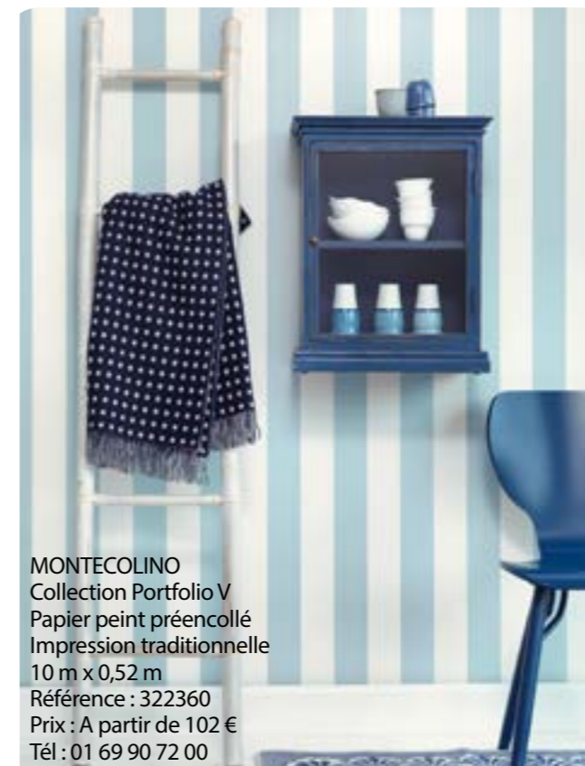
MONTECOLINO Collection Portfolio V Papier peint préencollé Impression traditionnelle 10 m x 0,52 m Référence : 322360 Prix : A partir de 102 € Tél : 01 69 90 72 00