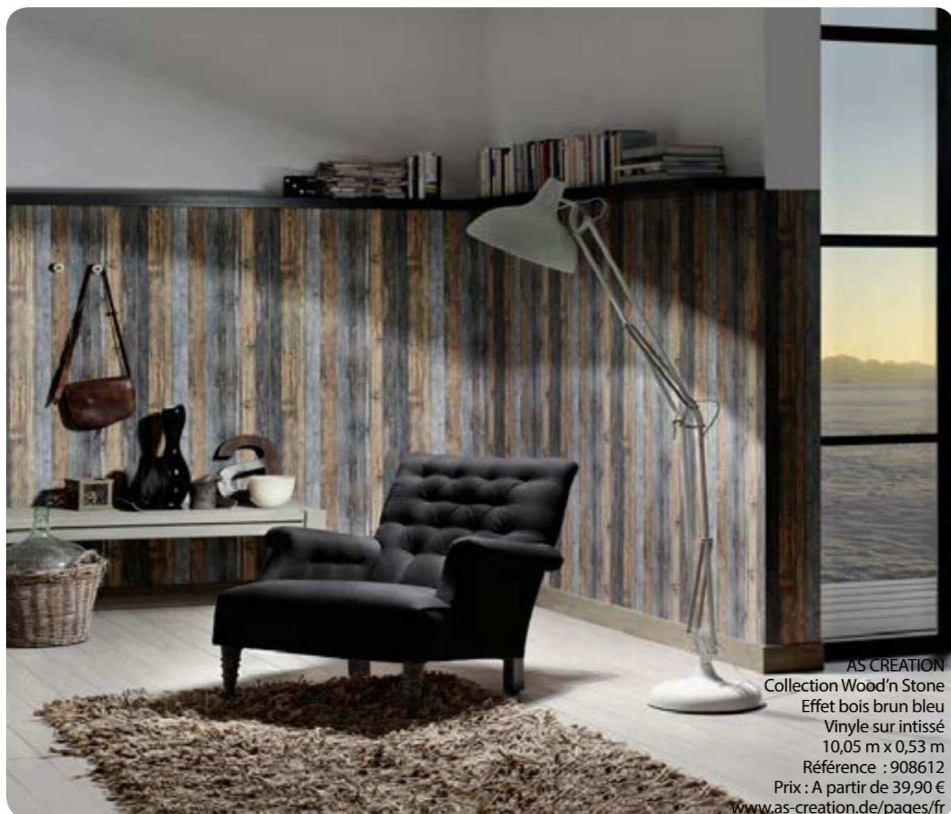
AS CREATION Collection Wood'n Stone Effet bois brun bleu Vinyle sur intissé 10,05 m x 0,53 m Référence : 908612 Prix : A partir de 39,90 € www.as-creation.de/pages/fr

www.le-papier-peint.com | www.intisse.com | www.facebook.com/lepapierpeint