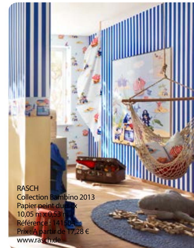
RASCH Collection Bambino 2013 Papier peint duplex 10,05 m x 0,53 m Référence : 141504 Prix : A partir de 17,28 € www.rasch.de

Créée en 1999, l'Association pour la Promotion du Papier Peint (A3P) représente les principaux acteurs du papier peint en France : fabricants, éditeurs, distributeurs et partenaires.