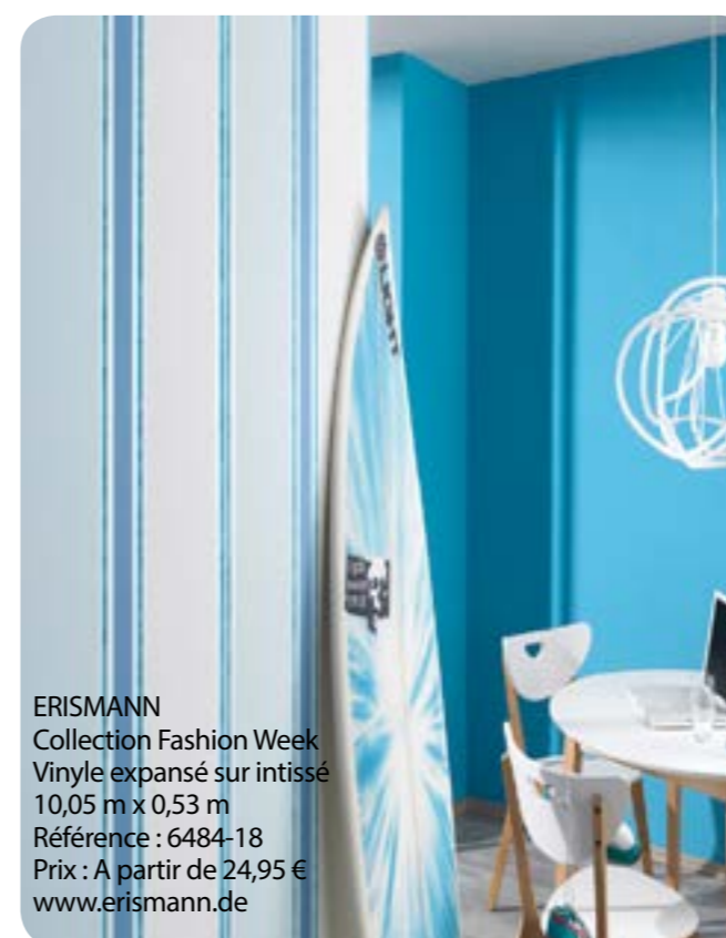
ERISMANN Collection Fashion Week Vinyle expansé sur intissé 10,05 m x 0,53 m Référence : 6484-18 Prix : A partir de 24,95 € www.erismann.de